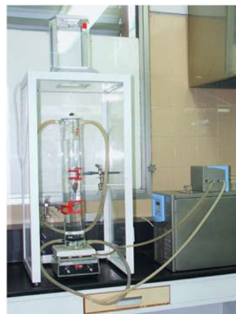
Figura 4. Imagen del equipo construido y armado para la calibración de densímetros.