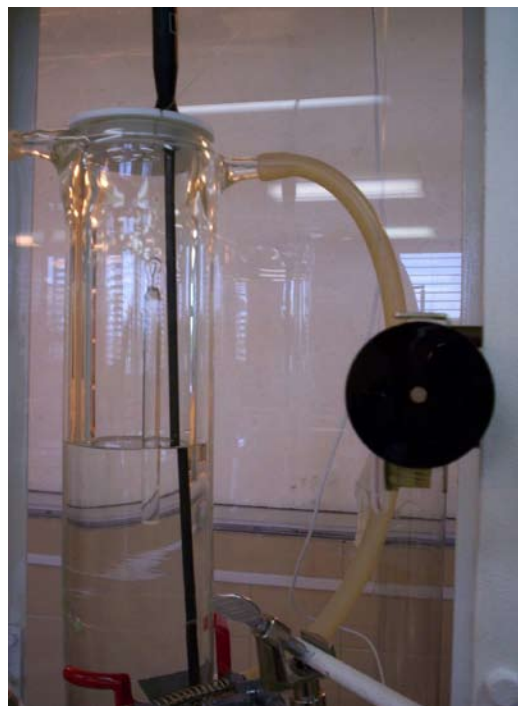
Figura 2. Detalle del cilindro de ajuste fino y poleas de ajuste de nivel.