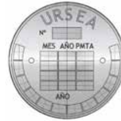
Figura: Esquema de la Placa de registro del generador de vapor

Artículo 64. Culminado el registro, se deben realizar las pruebas indicadas en la Sección VII a efectos de obtener la habilitación del generador de vapor.