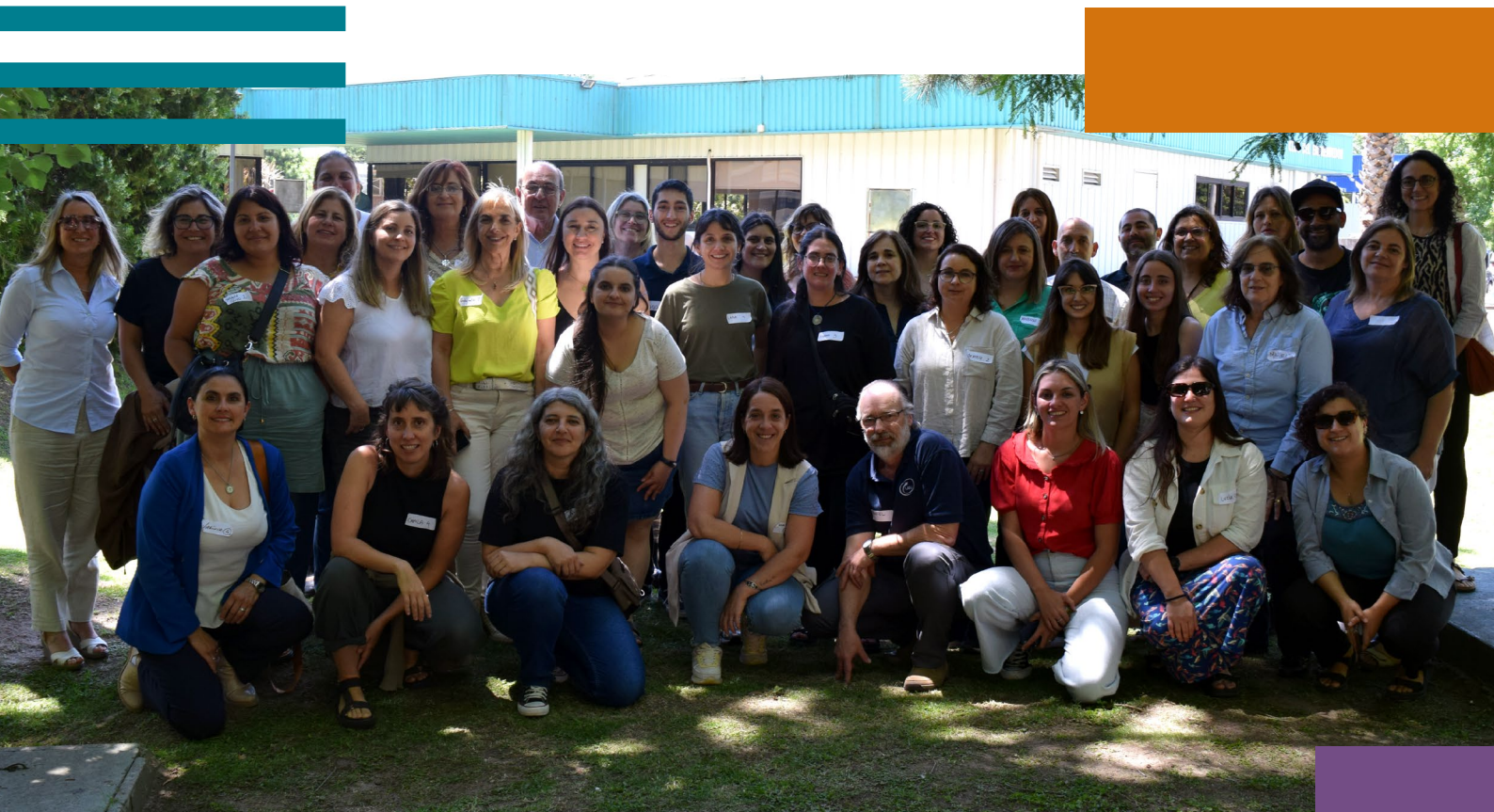
Foto 2: Encuentro Nacional de Equipos Técnicos de las Cocinas Comunitarias, dic. 2024.

Equipos técnicos y usuarios que participaron del relevamiento y Encuentro Nacional de Equipos Técnicos de Cocinas Comunitarias (diciembre 2024)