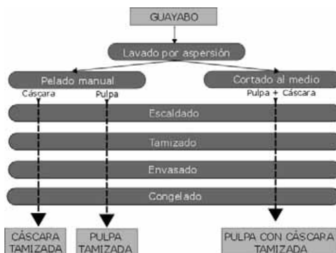
Figura 1: Diagrama de flujo del procesamiento de Guayabo del País

Se trabajó con lotes de 15kg, para cada tratamiento, no se hicieron réplicas de los mismos.