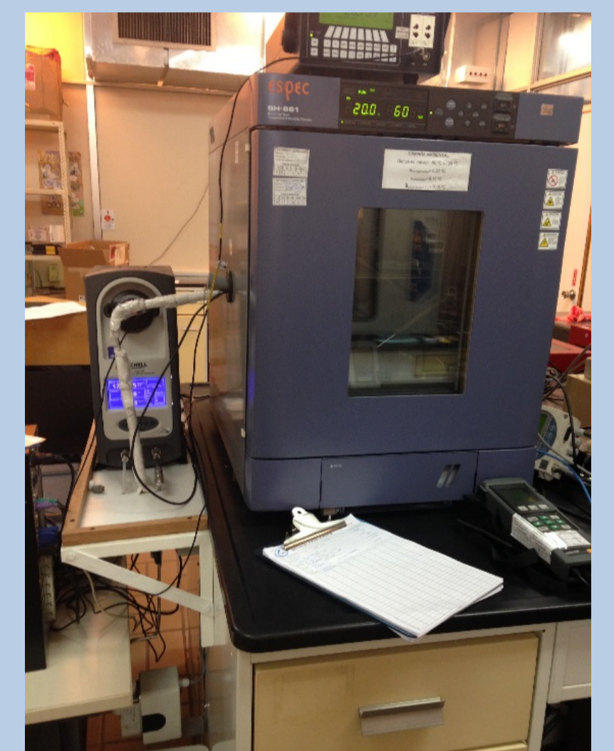
Fig. 2. Sistema de medición de higrómetros, patrón de medición de punto de rocío y cámara ambiental.

Al mismo tiempo que se registraron los resultados del estudio de homogeneidad se realizó determinación de la estabilidad de la cámara en el tiempo de medida habitual. El tiempo establecido para el estudio fue de 10 minutos, tomando medidas cada 30 segundos.