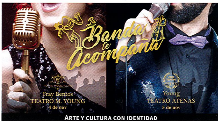
ARTE Y CULTURA CON IDENTIDAD