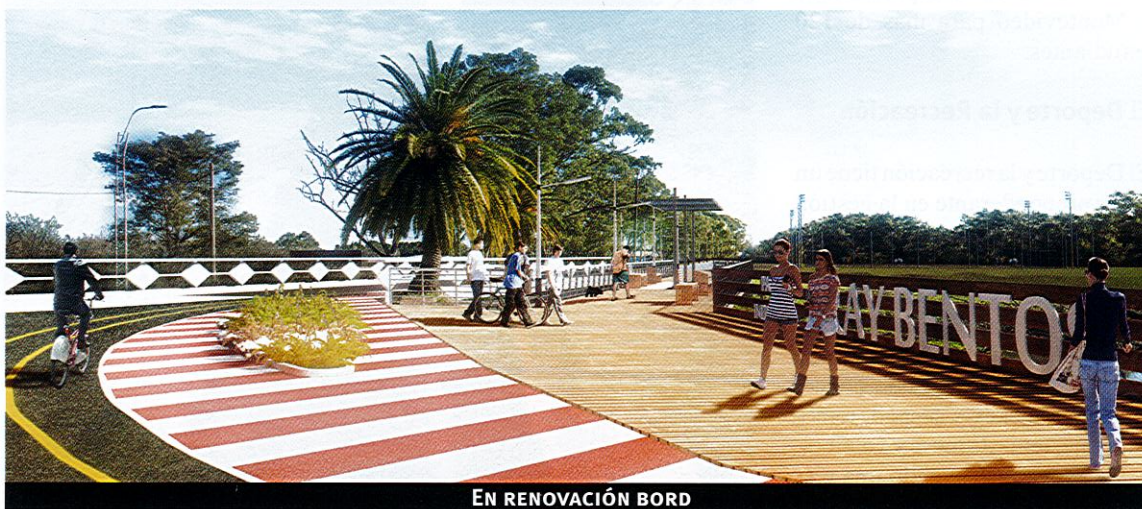
EN RENOVACIÓN BORD

Durante el año 2018, la Oficina de Planeamiento y Presupuesto y la Intendencia promovieron una serie de Talleres en los cuales la participación de vecinos, productores y otros actores relevantes en el uso de la red de caminos departamentales con el cometido de priorizar las intervenciones en los caminos estratégicos para el desarrollo del departamento cuyo resultado fue consagrado en un Plan de Vialidad Departamental.