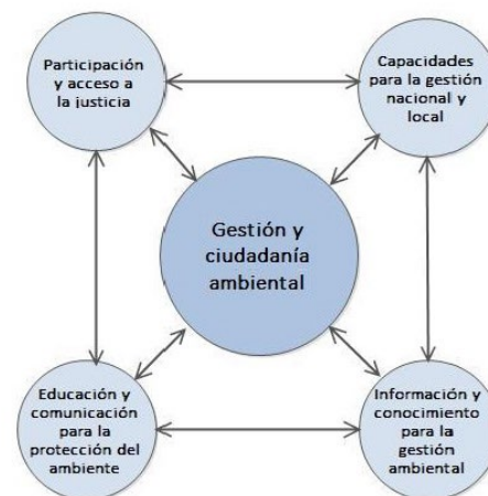
Figura 4. La dimensión de Gestión y ciudadanía ambiental, con sus Objetivos Específicos.

Apunta a fortalecer y generar ámbitos e instancias adecuadas de comunicación y participación amplia y efectiva, tanto en el sector público como en el privado, para involucrar a toda la población en el cuidado ambiental. El acceso a información pertinente, oportuna y de calidad se considera como una condición habilitante para que dicha participación pueda ser genuina y que sea tenida en cuenta en la toma de decisiones, por lo cual propenderá a atender las dimensiones de género y generaciones que condicionan su acceso y apropiación, así como la diversidad cultural y territorial de la población.