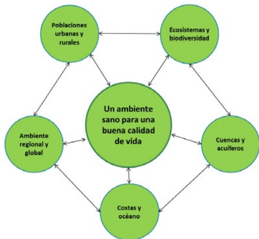
Figura 2. La dimensión de un ambiente sano para una buena calidad de vida, con sus Objetivos Específicos.

servicios ambientales y reconociendo el valor propio de la naturaleza. Esto permitirá avanzar en los marcos de derechos y responsabilidades, tanto en aspectos de derecho civil y penal, para la protección de la naturaleza.