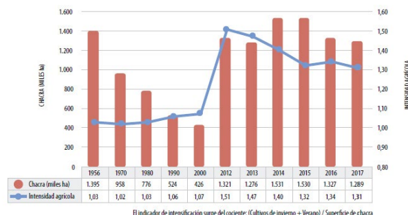
Figura 5. Evolución de la superficie de chacra e intensidad agrícola.

El área destinada a la producción agrícola, y en particular a los cultivos de secano (8,35% del total de la superficie agrícola según el Informe Nacional Voluntario ODS 2017), ha tenido un proceso de enorme expansión e intensificación de la agricultura, a pesar de la “explosión” entre el 2000 y 2014, hubo varias zafras que superaron ese valor (ocho, consecutivas, entre 1951 y 1958) (Saavedra, 2011 y Anuario OPYP, 2017), provocando cambios sociales, económicos y ambientales. Datos oficiales de la Dirección de Estadísticas Agropecuarias (DIEA) del MGAP muestran que el área destinada a cultivos de secano se multiplicó por cuatro entre 2000 y 2010, al tiempo que aumentó el número de cultivos por chacra.