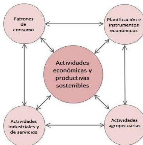
Figura 3. La dimensión de actividades económicas productivas sostenibles, con sus Objetivos Específicos.