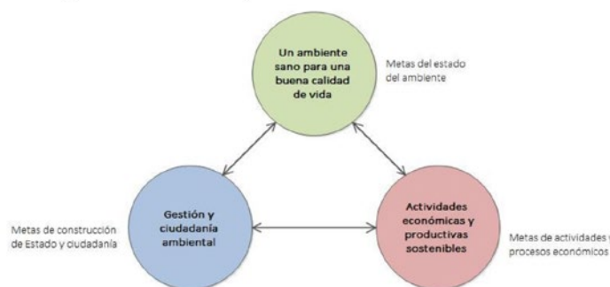
Figura 1. Dimensiones del Plan.

Cada dimensión está integrada por diversos objetivos específicos. Estos se definen a través de sistemas de análisis que no deben verse como una compartimentación de los sistemas ambientales sino como resultado de construcciones históricas, marcos institucionales y capacidades de gestión que permitirán el abordaje integral de las problemáticas.