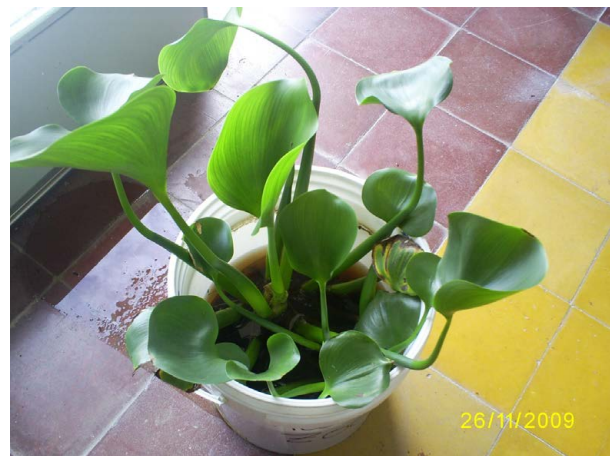
Figura 1. Eichhornia crassipes en presencia de efluente secundario al principio del ensayo.

En noviembre de 2009 los ejemplares de E. crassipes fueron expuestos al efluente por duplicado, utilizando régimen de lote, en tanques de polietileno de 20 litros conteniendo cinco litros de la muestra de efluente cada uno (Figura 1). La exposición fue de 31 días y se mantuvo en un lugar protegido dentro del laboratorio, con luz natural y a temperatura ambiente. Las pérdidas en volumen de cultivo debido a la evapotranspiración fueron contrarrestadas por adición de agua desionizada hasta el nivel original día por medio. Como control negativo se tomó una muestra de efluente (antes de comenzar con el ensayo) y se analizaron valores de conductividad, pH, nitrito, nitrato, fósforo total y fósforo soluble, para poder ser comparados con los valores del efluente al terminar el ensayo.